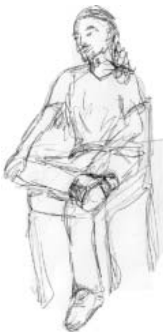
Teckning av Nisse, klass 10.